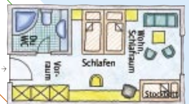
Familienzimmer (mit und ohne Balkon)